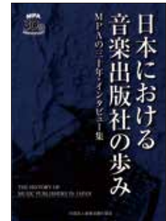
『日本における音楽出版社の歩み MPAの三十年・インタビュー集』