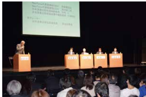
シンポジウム「新たな著作権管理団体の誕生によって変わる変わらないこと～イーライセンス／JRC事業統合の狙いと影響～」。400名もの音楽関係者が集まりました。

さらにMPAでは、1995年以来、音楽出版・作家契約相談室を設けています。著作権ビジネスが健全な発展、成長を続けるための基盤となる、著作者と音楽出版社との信頼関係をより深めることを目的に、MPAに加盟する音楽出版社との現行著作権契約について疑問、あるいはご不明な点などについて、ご相談をお受けしています。