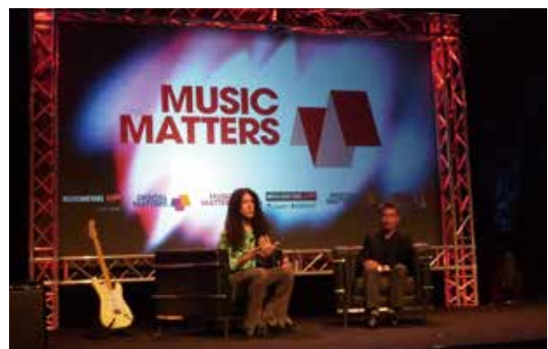
2012年のMUSIC MATTERSで行われたセミナー「The J-POP Phenomenon」。スピーカーには世界的なギタリストで、J-POPにも精通したマーティ・フリードマン氏を迎えました。