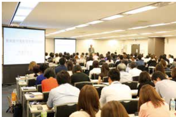
音楽著作権管理者養成講座の会場は、熱心な受講者の方々が毎年満員になります。2016年度からは過去に講座を修了した方を対象とした再履修制度を新設しました。

1991年の開講以来、すでに4,000人を超す受講者が50時間に及ぶ課程を修了。その多くが音楽業界を担う人材として活躍しています。