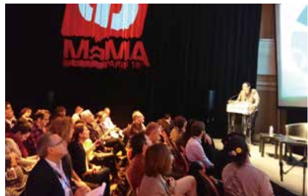
2018年のMaMAで行われたカンファレンス「Welcome to JAPAN」。日本の音楽マーケットの特徴や現状について、海外の音楽関係者に紹介しました。