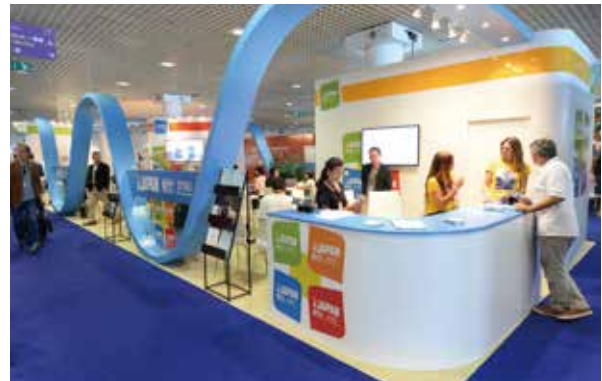
JETRO(独立行政法人日本貿易振興機構)と共催でジャパンスタンドを出展し、世界各国からの参加者と日本からの参加者が商談する姿が大いに賑わいました。

MPAは音楽出版社の国際組織であるICMP(International Confederation of Music Publishers)に設立時から参加、アジア地域から唯一の理事に選出されており、音楽出版の国際動向について情報交換を行い、積極的に著作権保護の推進を図っています。